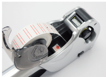
●分かりやすいラベル通し口