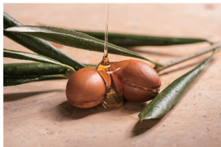
Argan Oil アルガンオイル

髪や肌の乾燥対策に使える美容オイルとして定番成分です。ビタミン E とポリフェノールを豊富に含み、髪になじみやすく、保湿力があるのにベタつかないのが特徴となります。