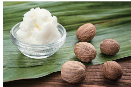
Shea Butter シアバター

砂漠で採れた黄金の液体と呼ばれ、肌なじみが良くさらとした。使用感と優れた保湿力で、お肌と頭皮のお手入れに適しています。