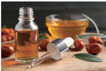
Jojoba Oil ホホバオイル

髪や肌の乾燥対策に使える美容オイルとして定番成分です。ビタミン E とポリフェノールを豊富に含み、髪になじみやすく、保湿力があるのにベタつかないのが特徴となります。