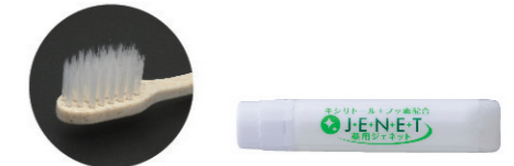
極細植毛 5.0gシュリンク