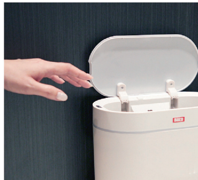
センサー式自動開閉