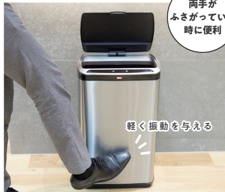
振動感知式自動開閉